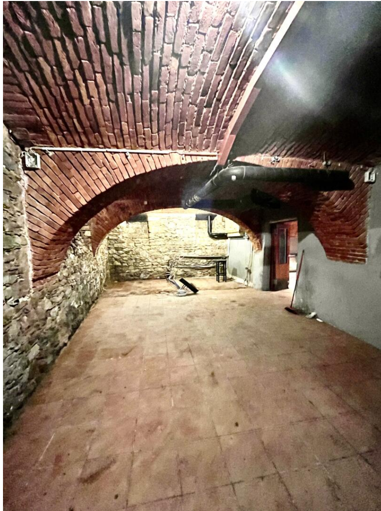
2 Barraum mit eigenem Zugang

Gewölbelokal - selbst Gestaltung- Keine Ablöse -Top Lage Univiertel: Öffnungszeiten von 18 Uhr bis 6 Uhr möglich - unmöbliert