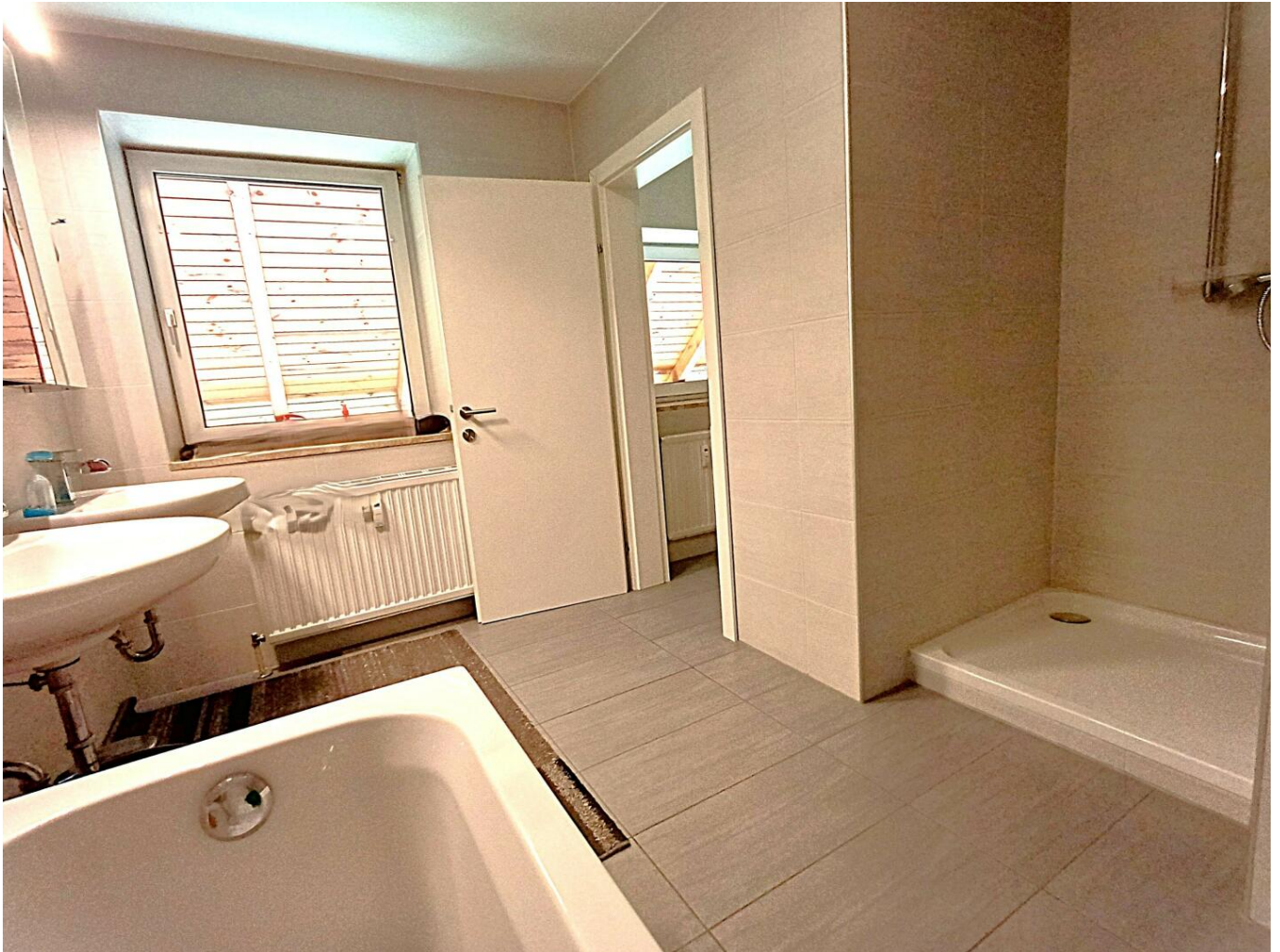
03a Bad mit Wanne + Walk in Dusche

Absolute Ruhelage in Seiersberg bei Graz: komplette Haus-Etage....123m 2 Wohnfläche..4 Zimmer..Top Infra..