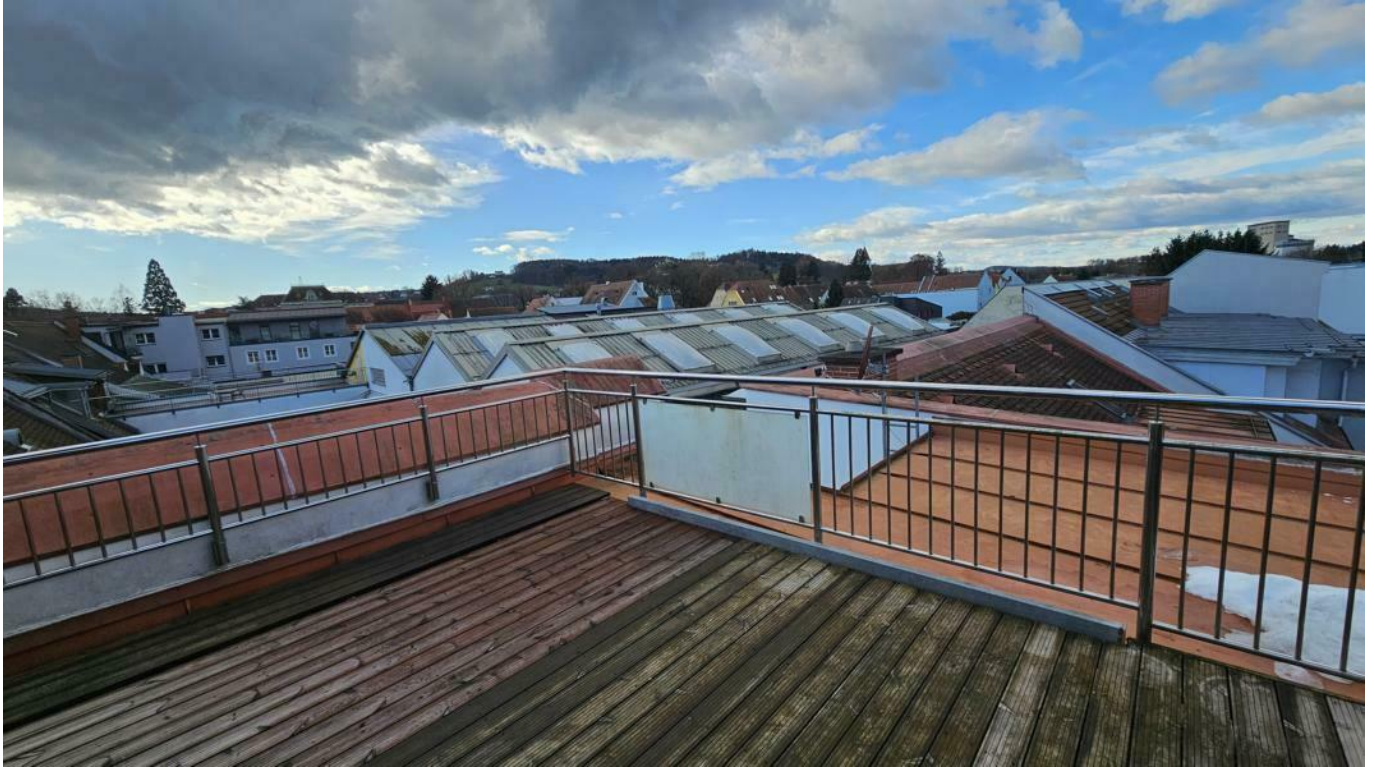
Panoramablick von der Dachterrasse