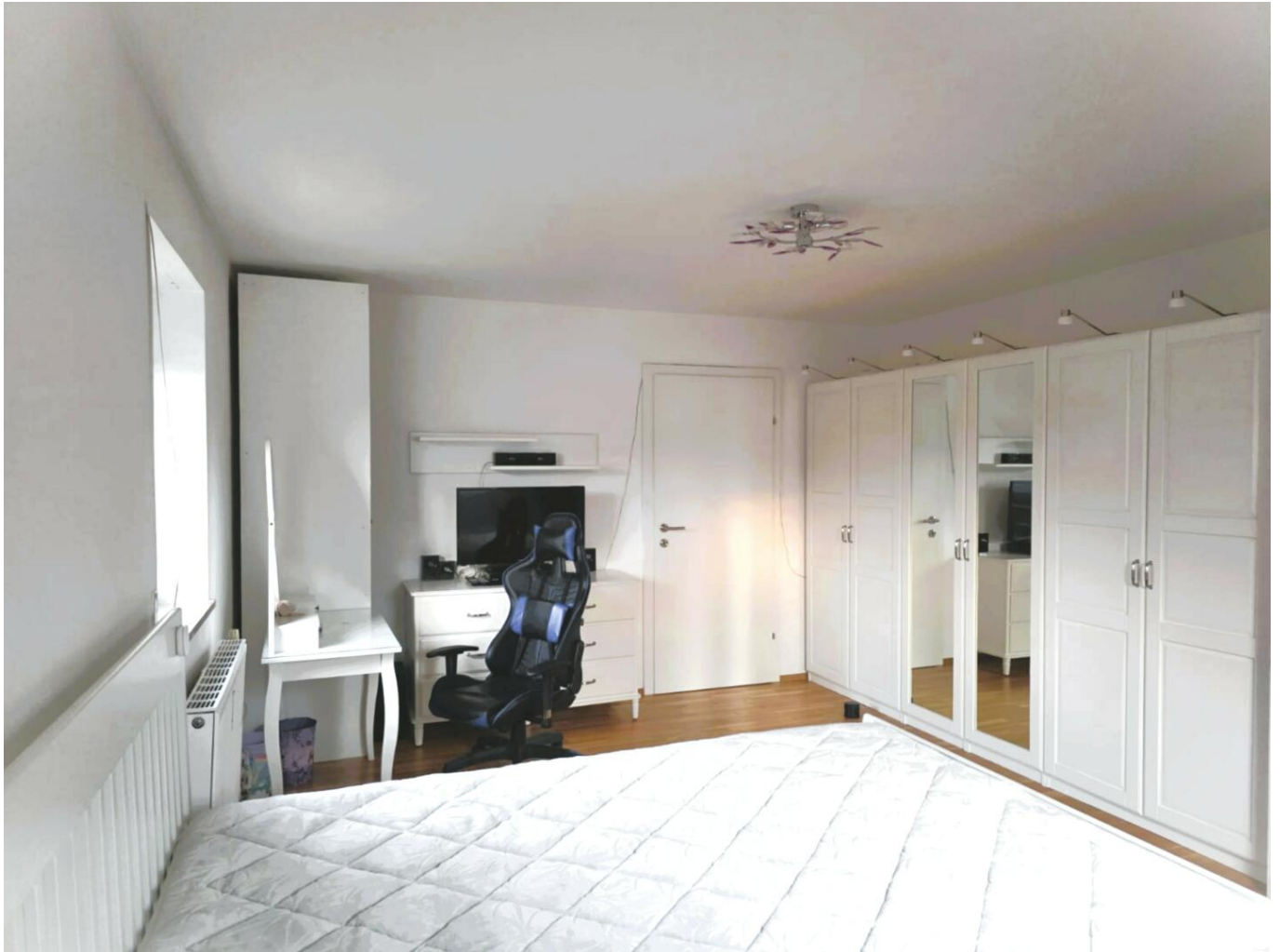
04 Zimmer 4