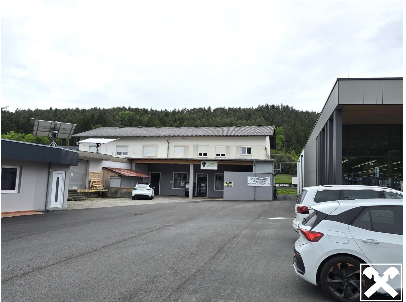
Geschäfts- und Wohnhaus in Bleiburg