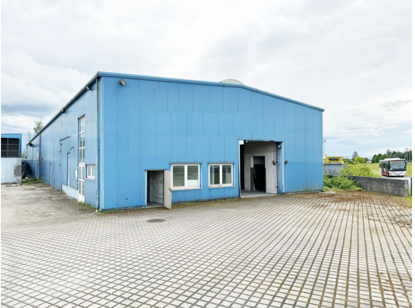
Kalthalle mit großer Freifläche