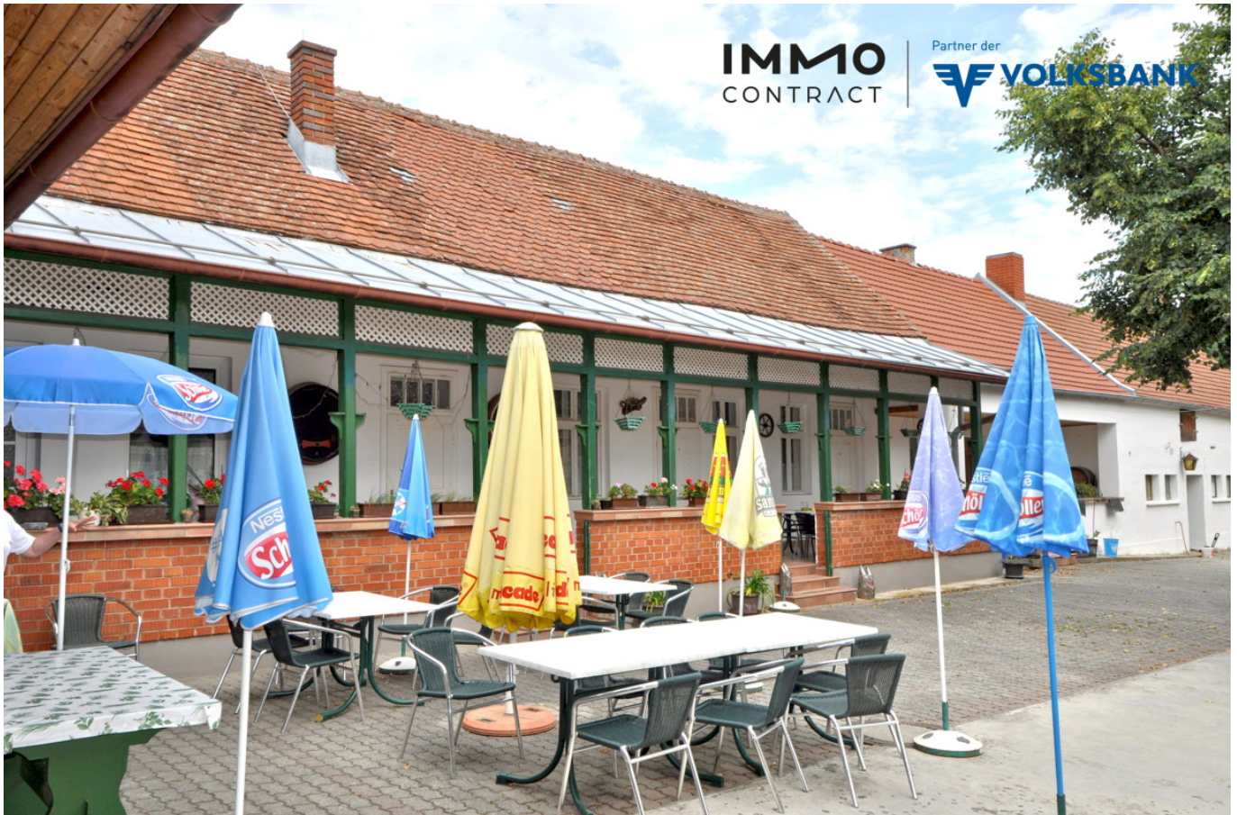
Gastgarten und Blick auf die Vernada der Gästezimmer