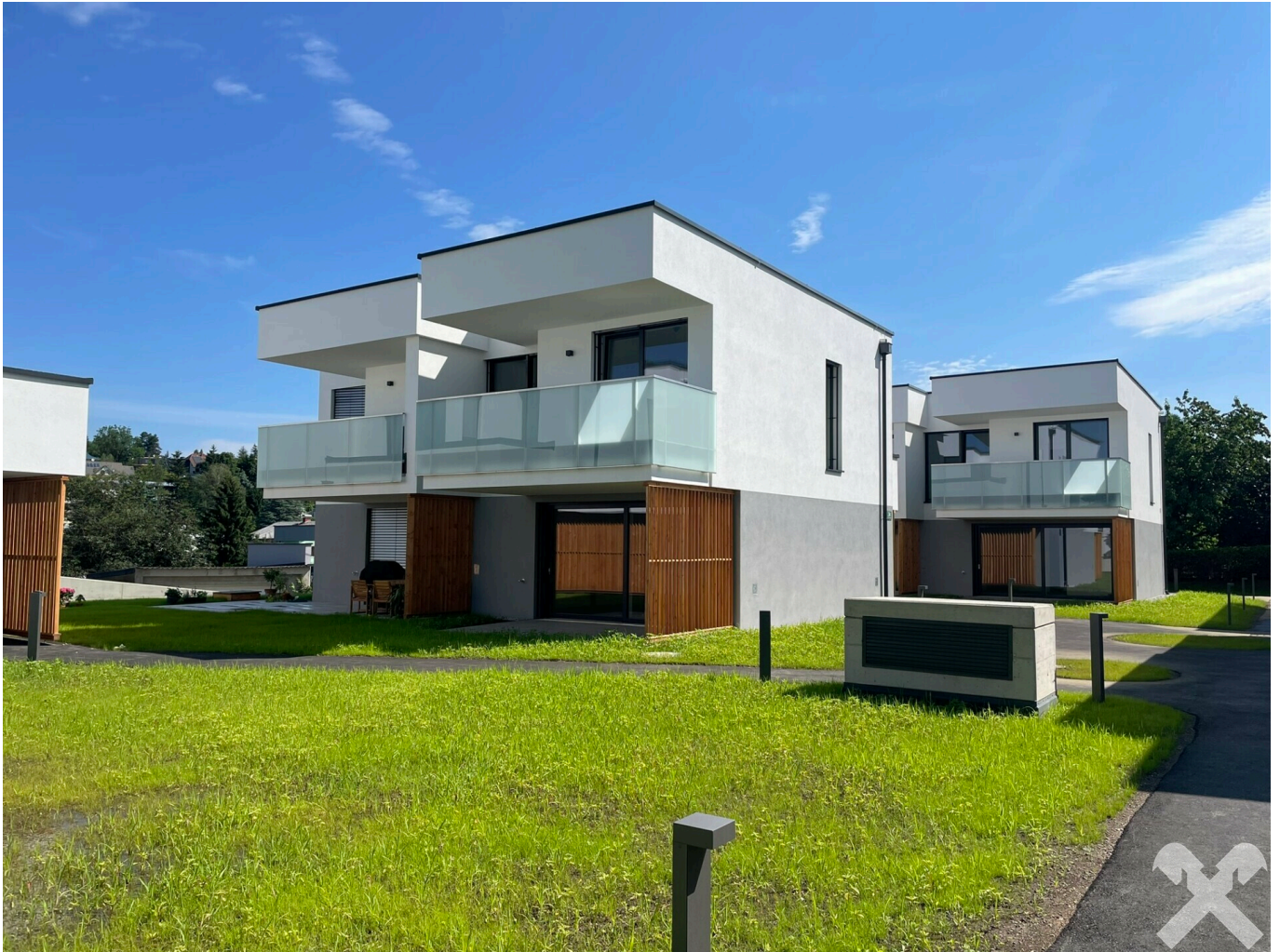
Außenansicht Top 9