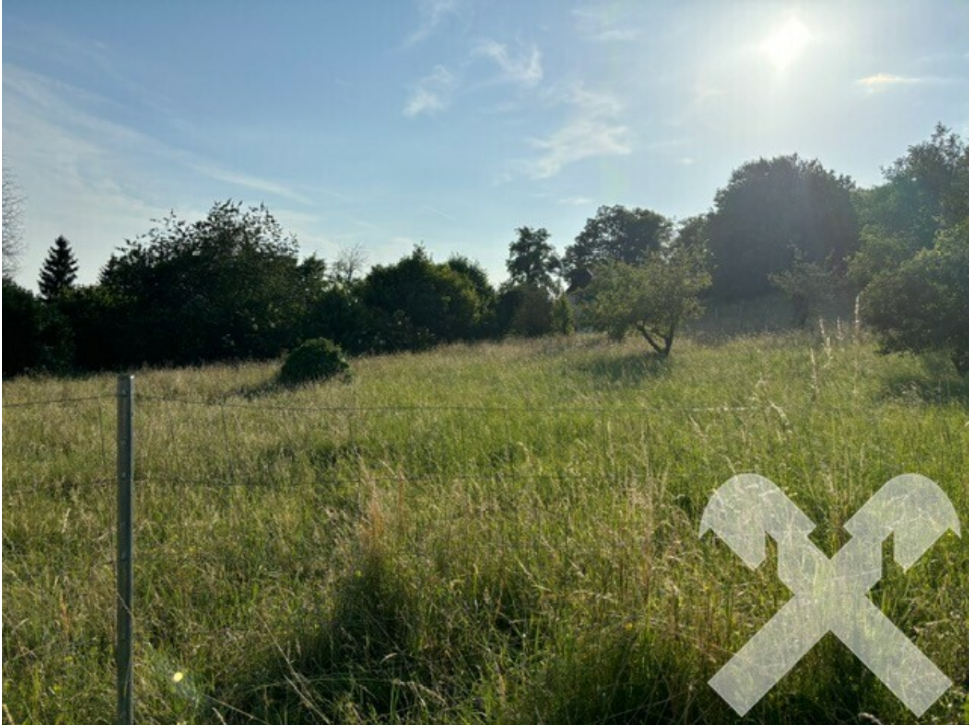
Baugrund mit Aussicht