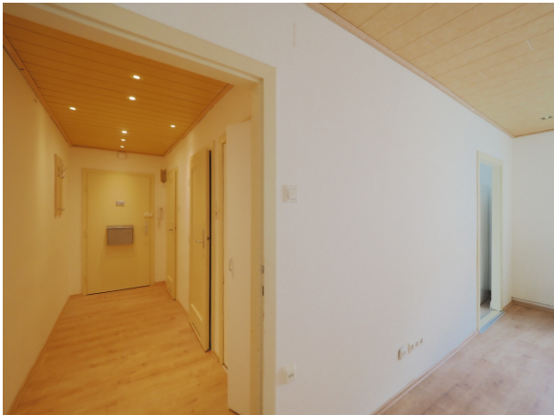
Mietwohnung Wiener Neustadt