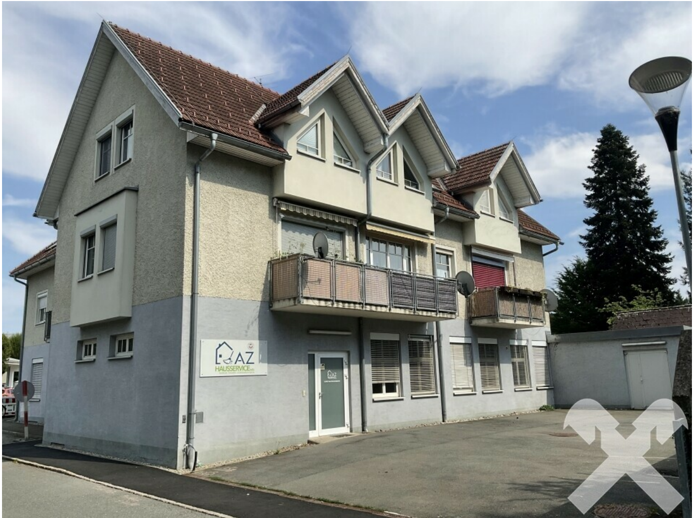
Rückwärtige Eingang und Parkplatz