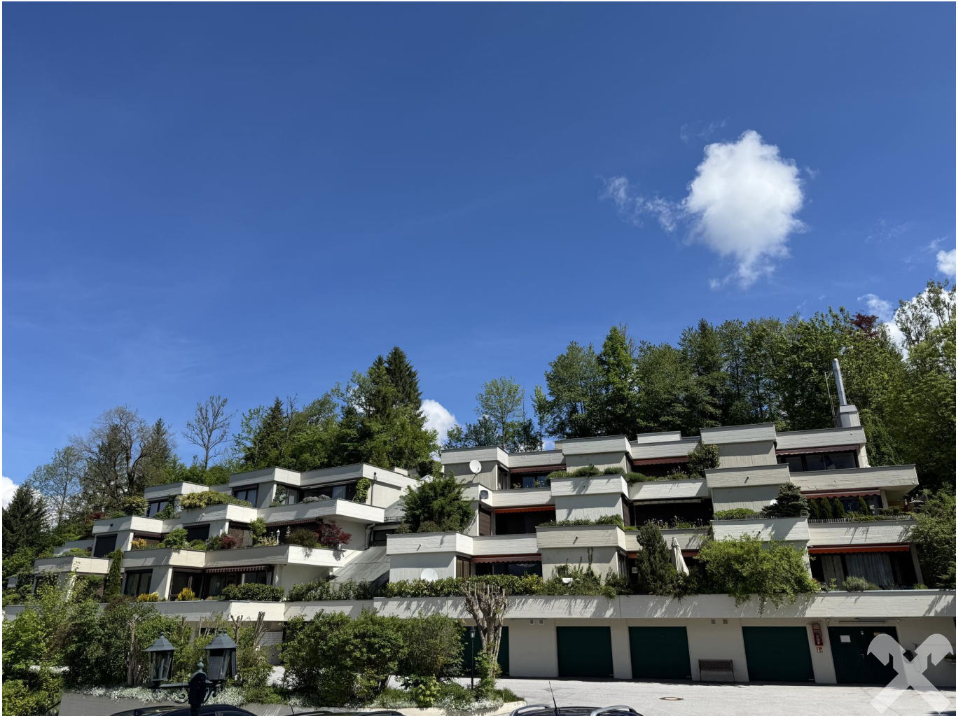
Außenansicht der Anlage