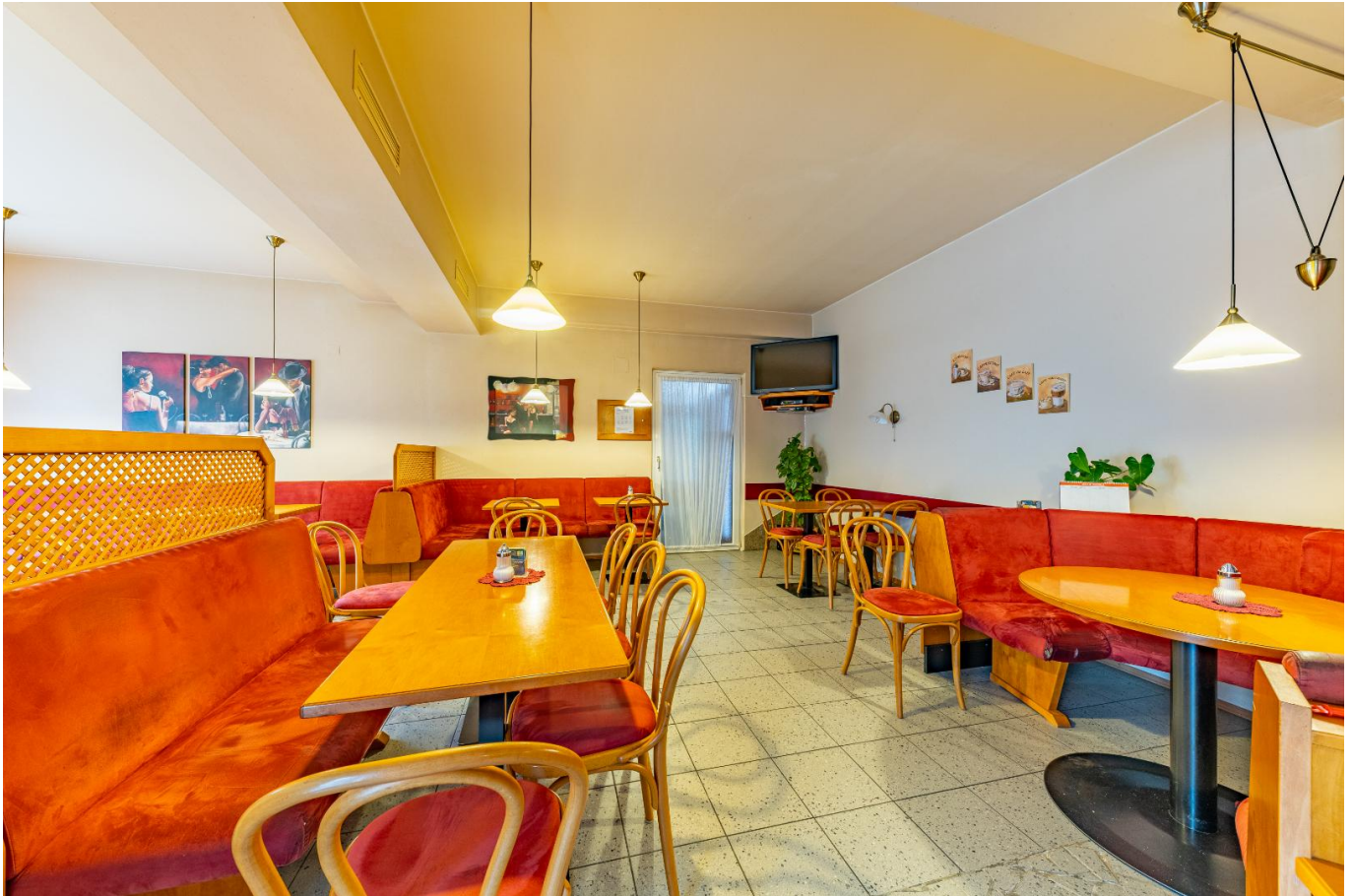
Café 3701 2