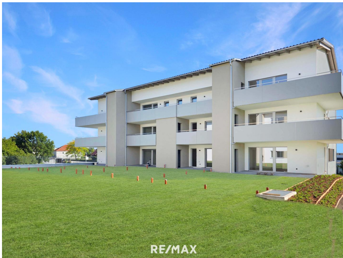
EG Haus 2 Top 01