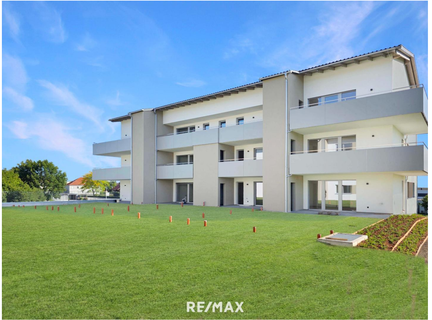
EG Haus 2 Top 04