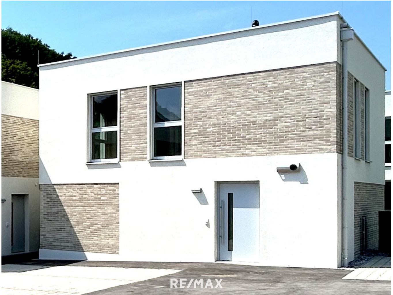
Haustyp II - Haus 17