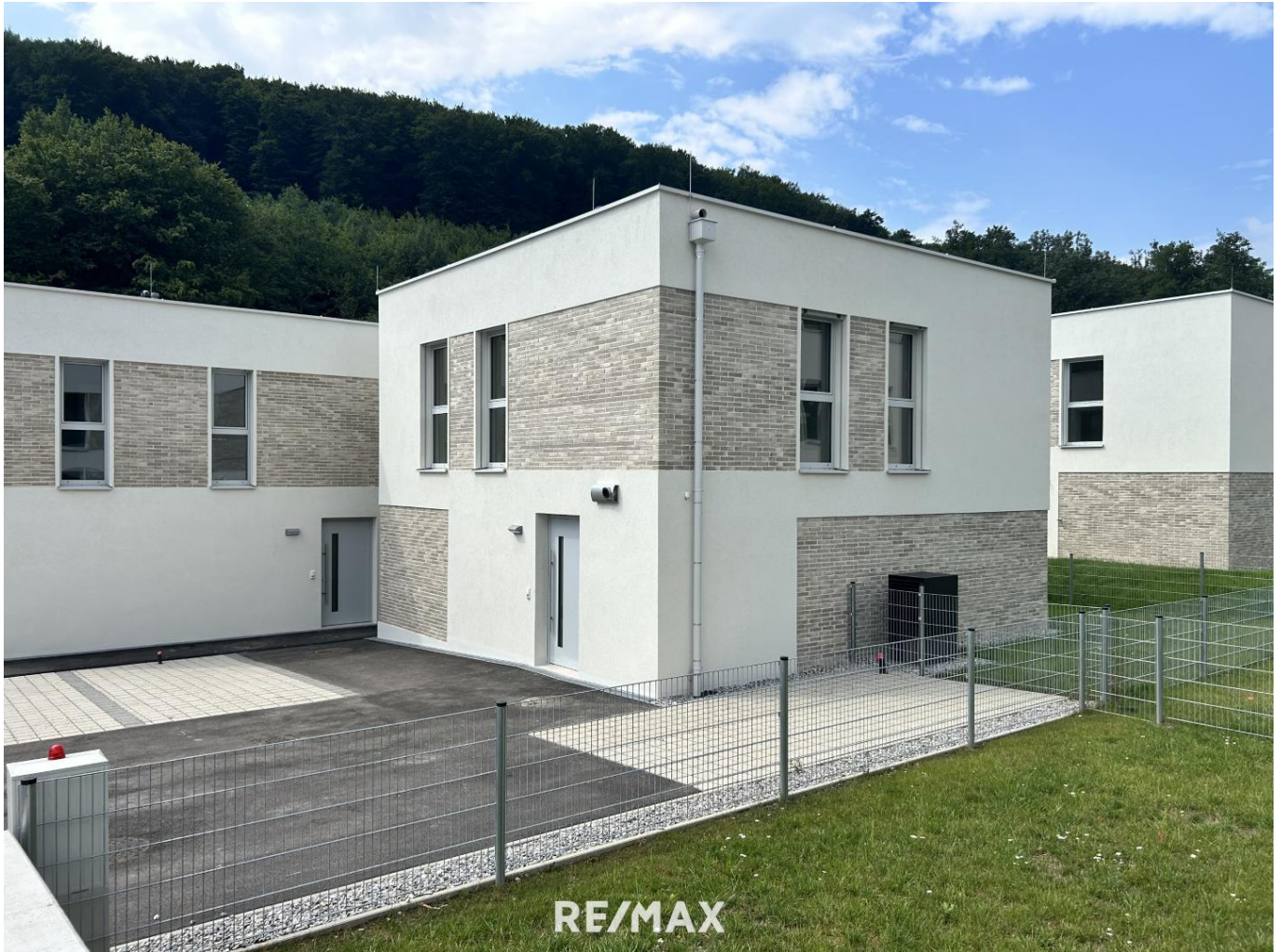
Haustyp II - Haus 19