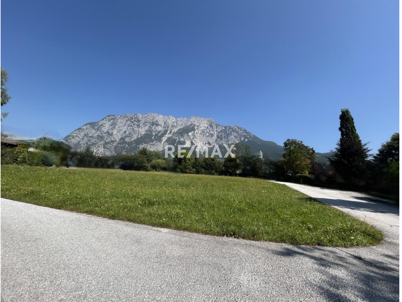
Blick Richtung Kamm im Norden