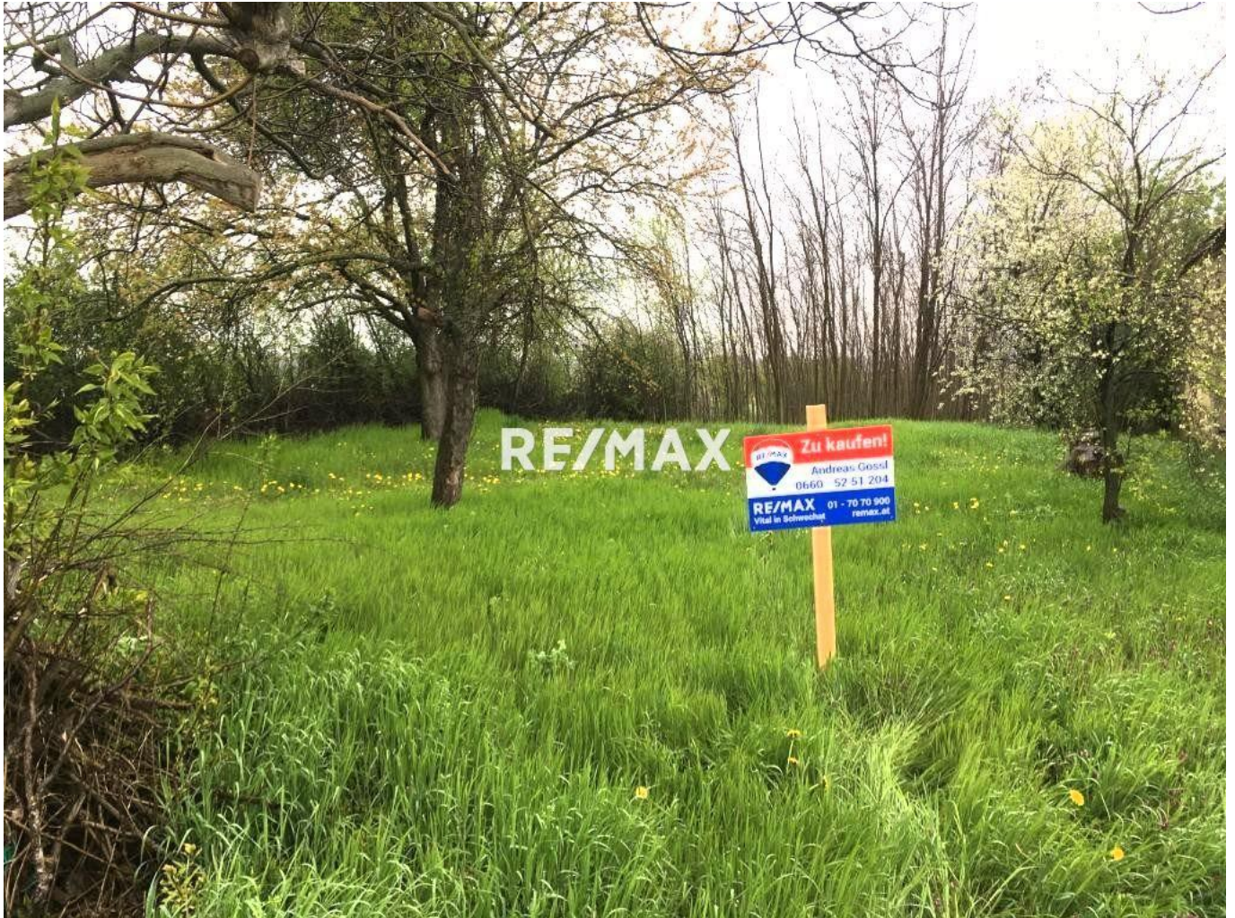
Grundstück Vaszar mit Tafel