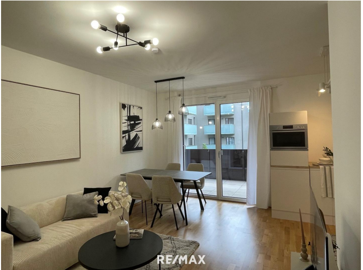
Eine mögliche Kueche