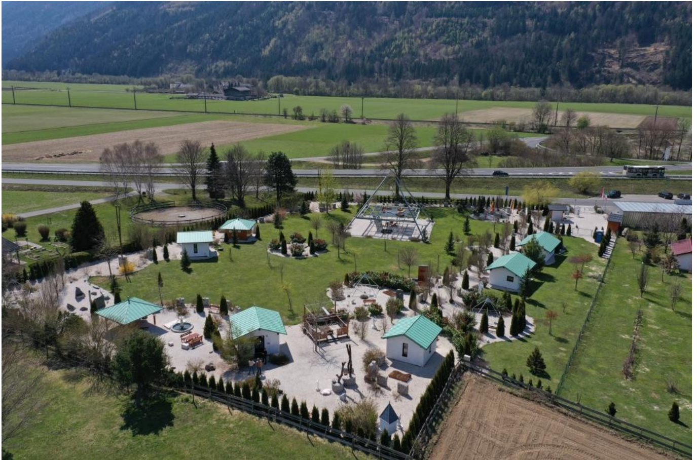
Energiegarten von oben