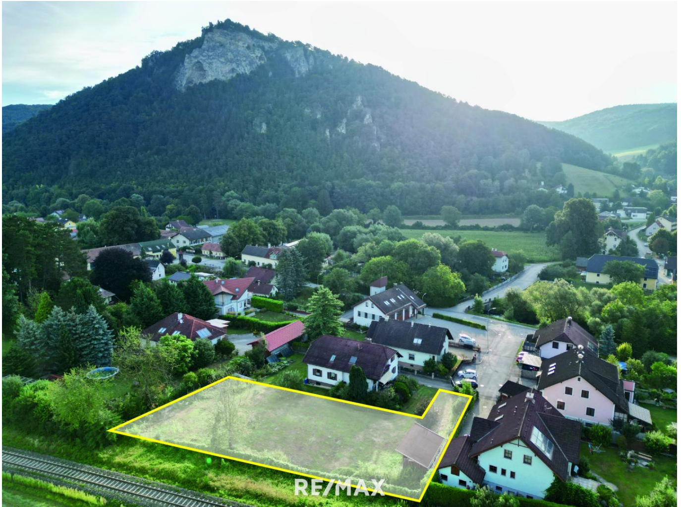
1. Grundstück von oben