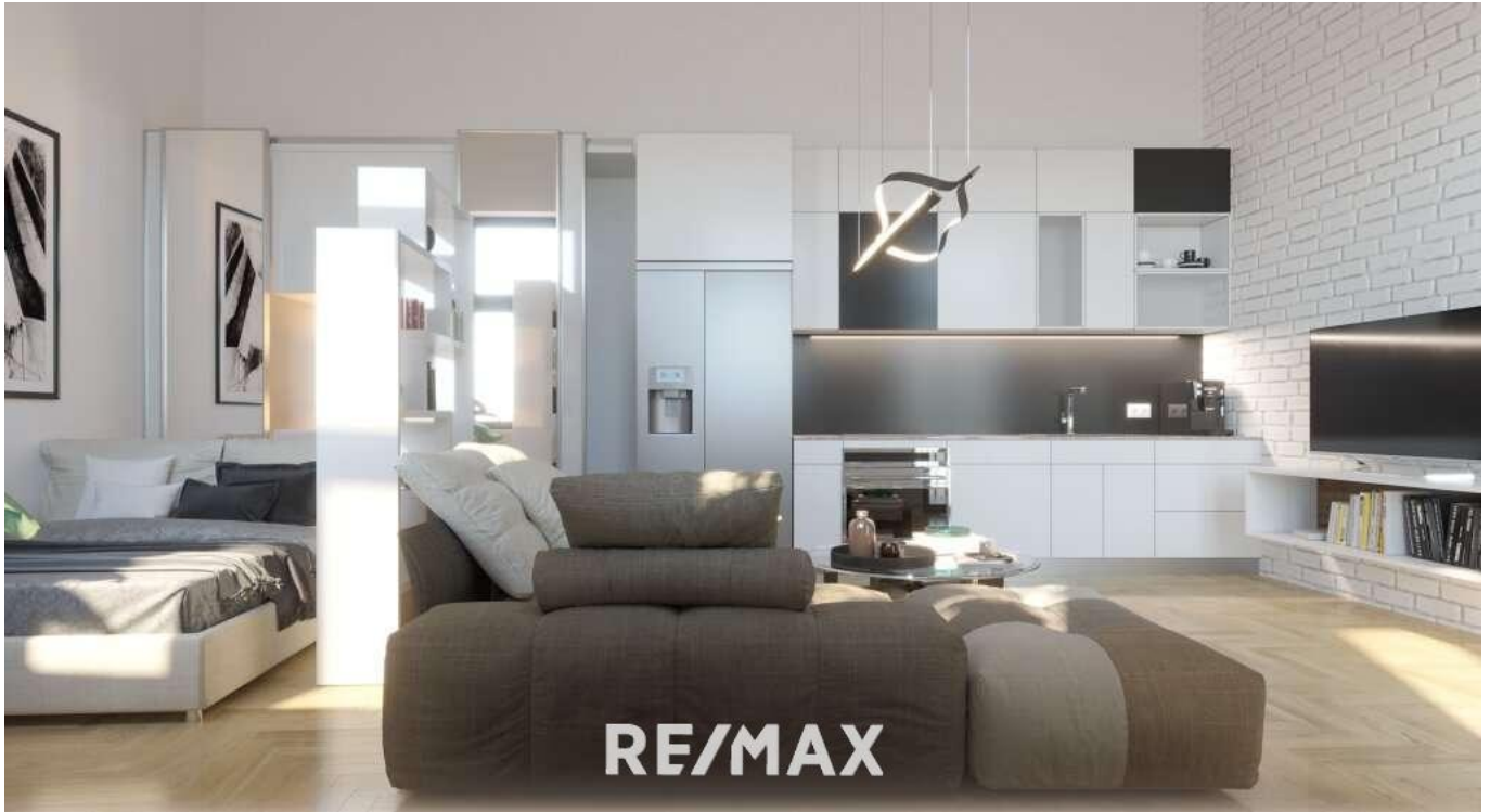
Bild 1 Wohnung 1070 Wien