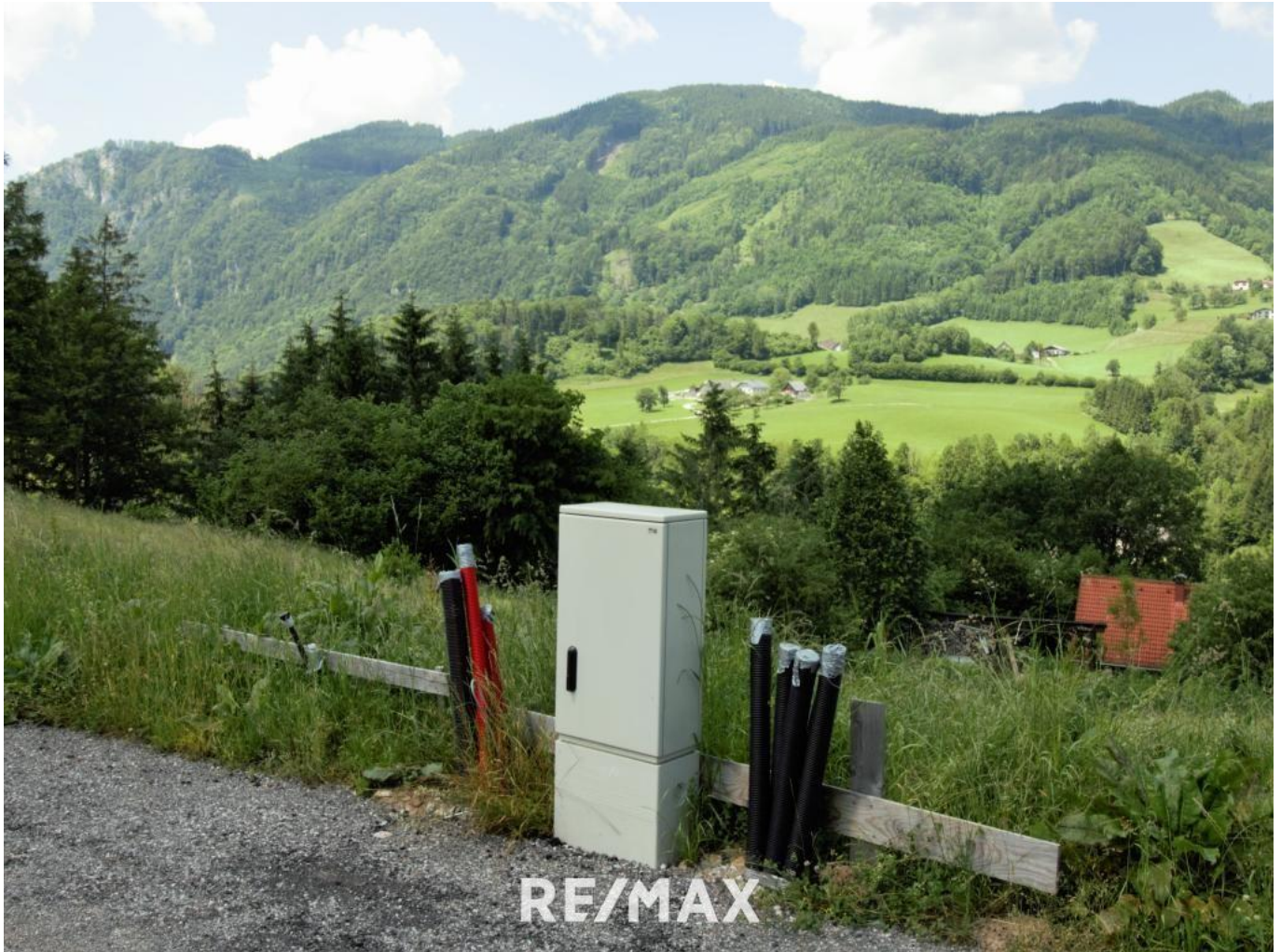
Baugrund mit Aussicht