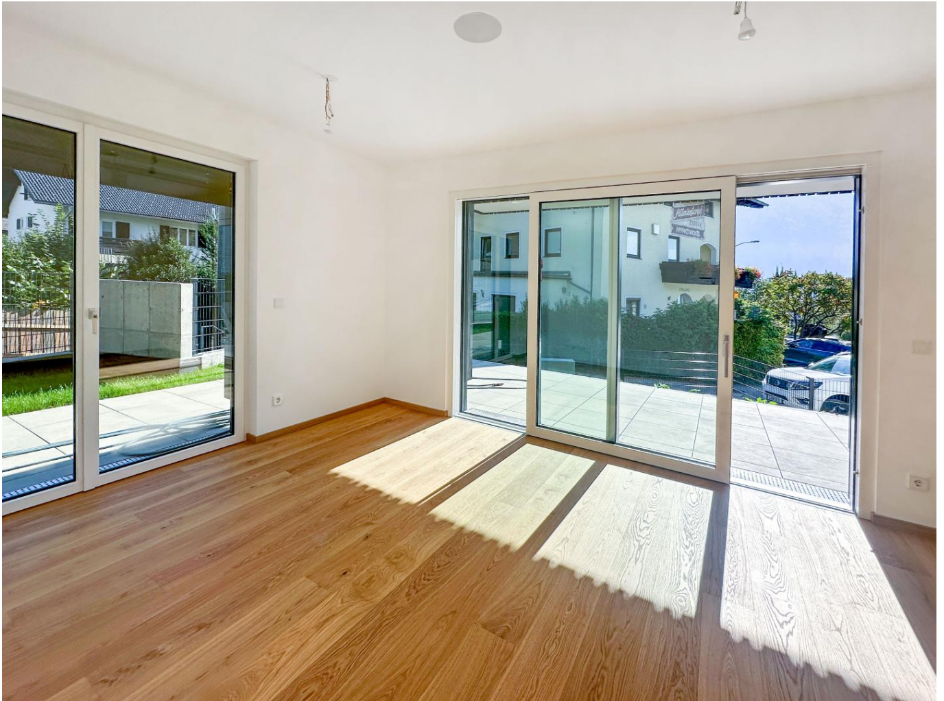
Wohnzimmer mit Ausgang auf die Terrasse/Garten