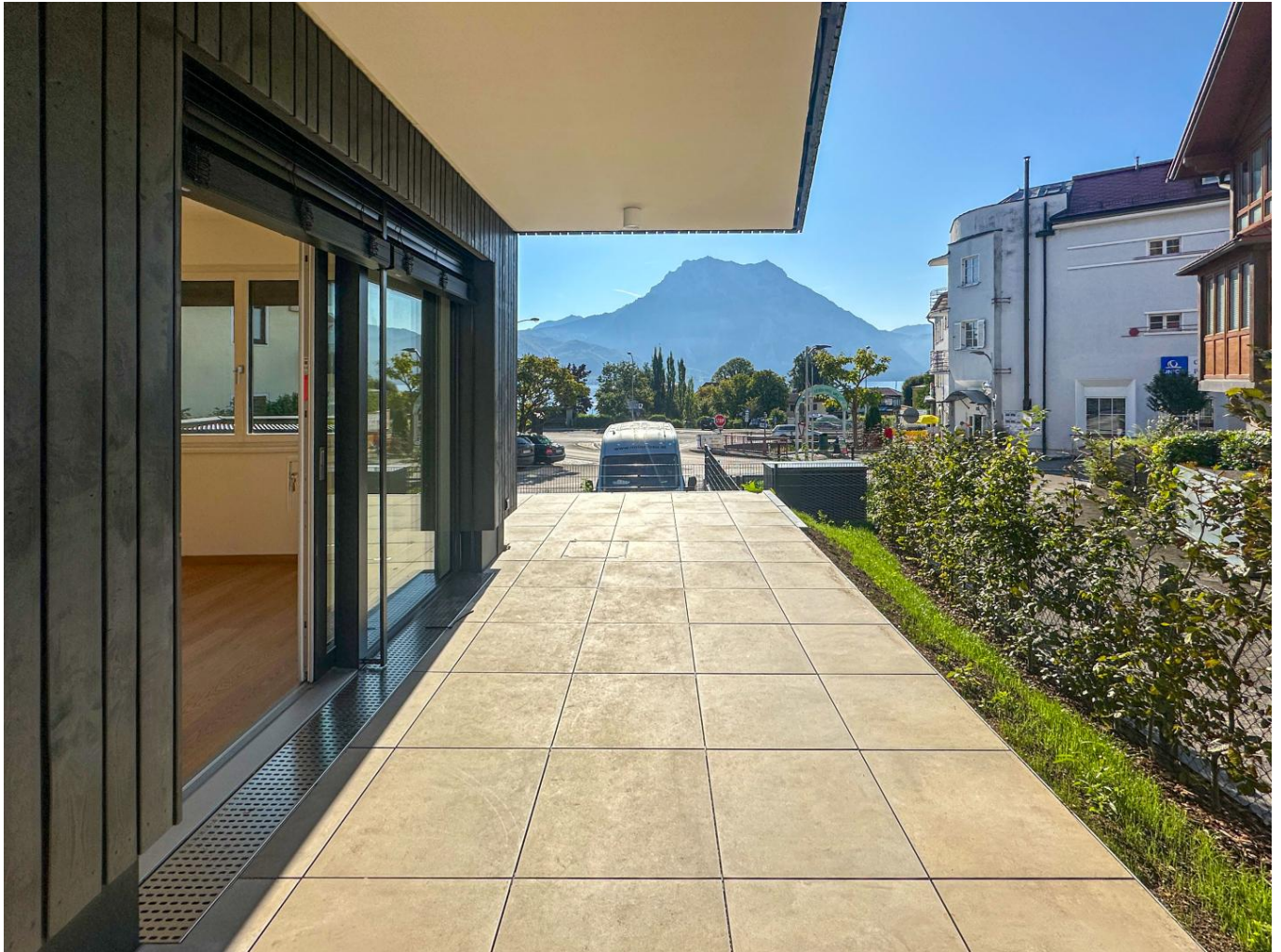
Ausblick von der Terrasse