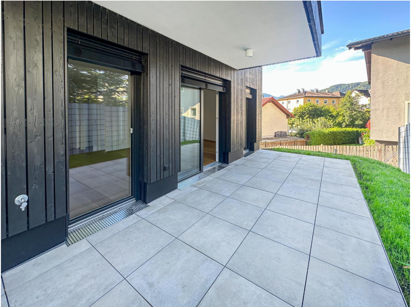
Terrasse & Garten