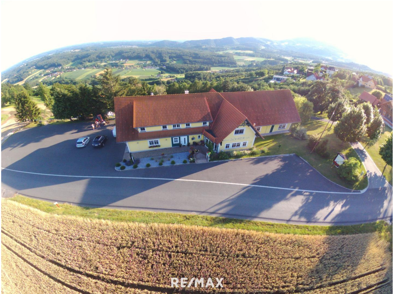
Drohnenfoto Haus von vorne

Geschäftslokal für Catering, Altersheim, Gasthaus, und anderen vielseitigen Möglichkeiten.