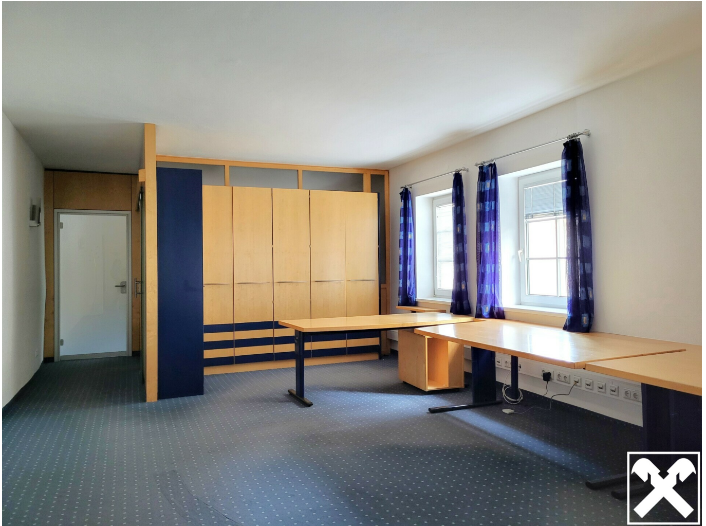
Bürraum 2_Bild 1

Bestlage und hervorragend in Preis-Leistung!