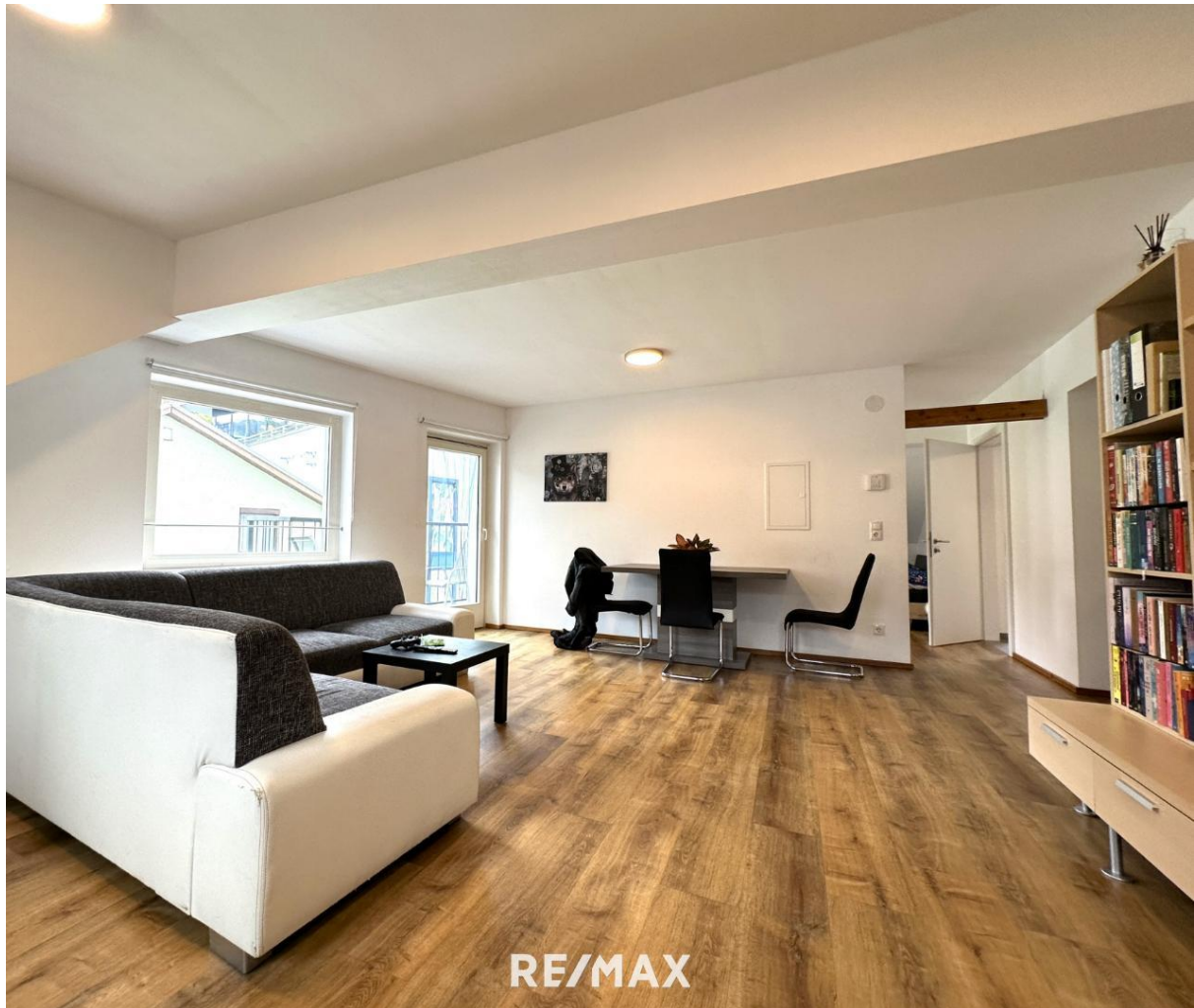
Wohnung - Wohnbereich

Objektnummer: 1613_10858 Eine Immobilie von RE/MAX Recon