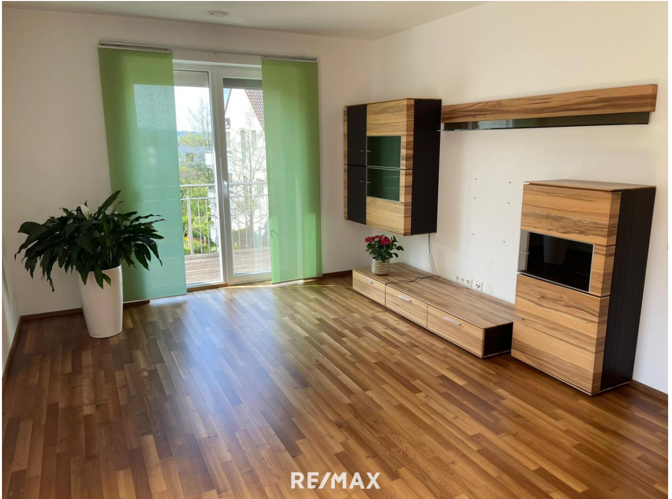
Titelbild - Wohnzimmer