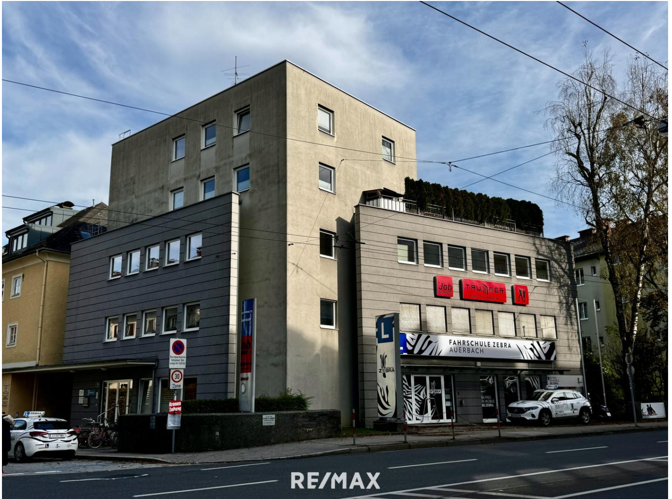
Ansicht West Seite Alpenstraße