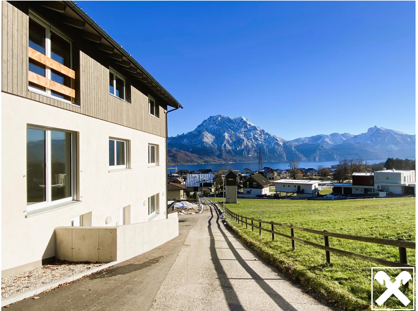
Außenansicht mit Ausblick