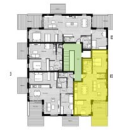
Übersicht 4. Obergeschoss