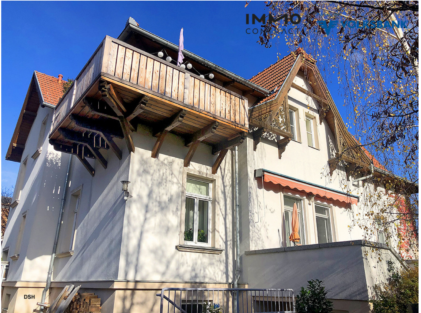
4WE - Zinshaus