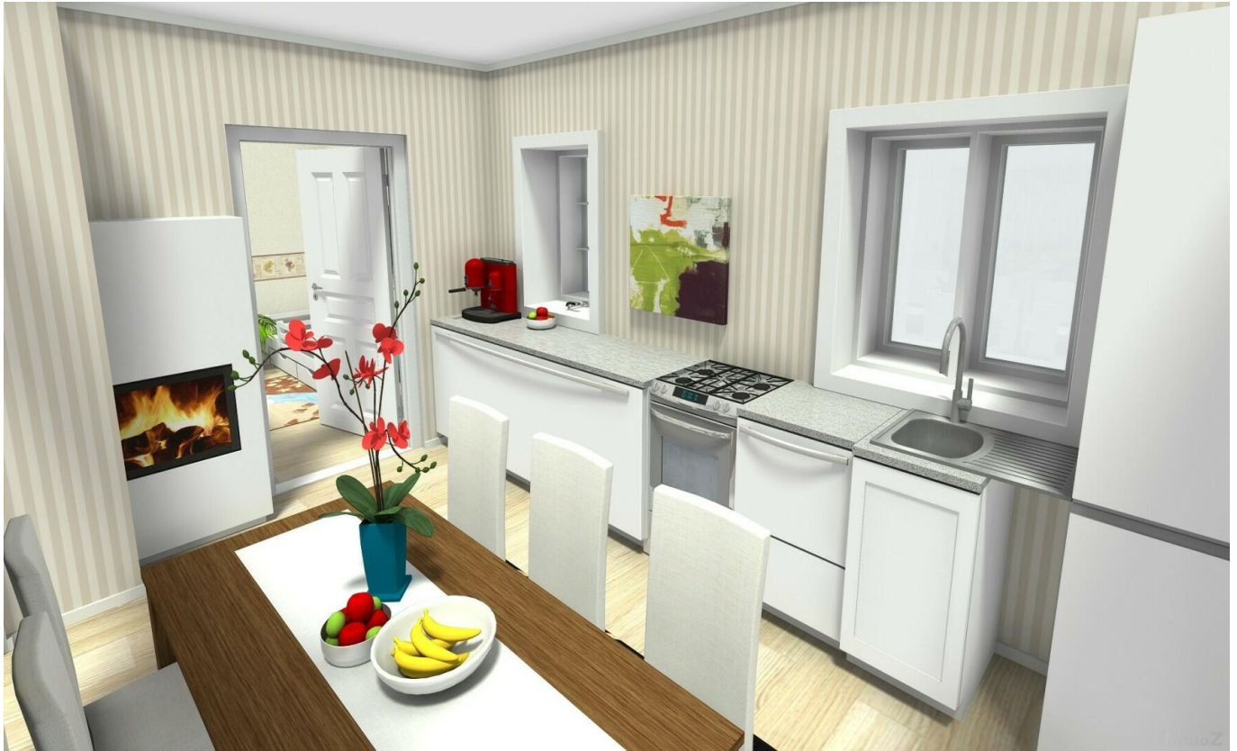
Küche mit Essbereich Wohnung Bad Strassgang AW - 3D Foto