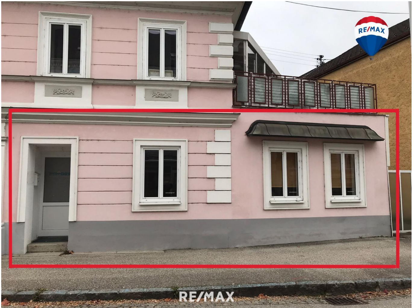
Titelbild - Mietobjekt markiert

>>> VERMIETET <<< Büro- und Geschäftsfläche in zentraler Lage