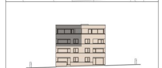
HAUS WEST ANSICHT SÜDWEST