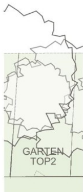
TOP2 Übersichtsplan Garten