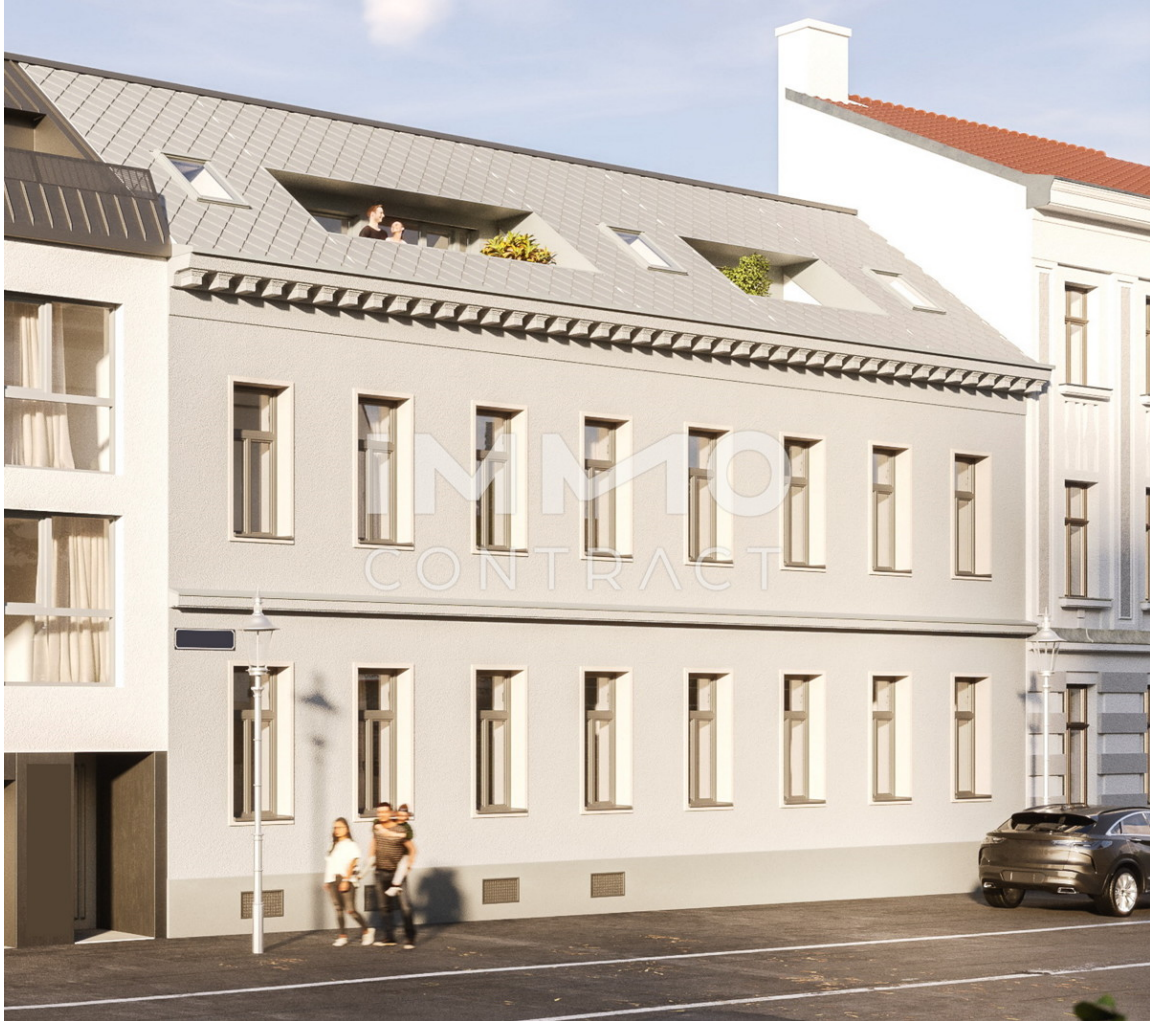
Straßenansicht IC Altbau